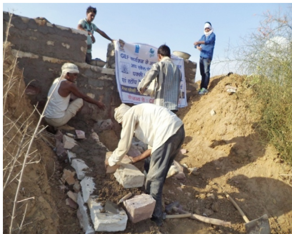
डोरबंदी के बीच जल निकास नाली निर्माण।