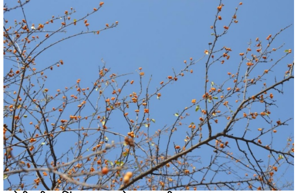
चमेनी की कटिंग व फल से आय वृद्धि।