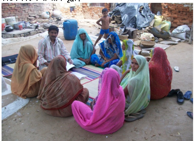
लघुवन उपजों से स्वयं सहायता समूह व लोगों को लिंक कर उनकी