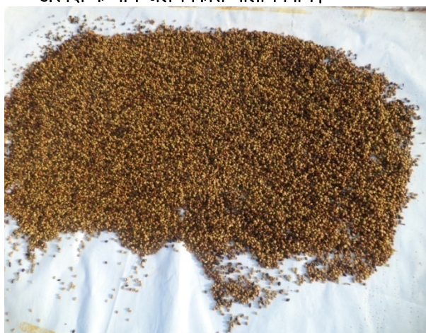
बीज विक्रय से आय वृद्धि।