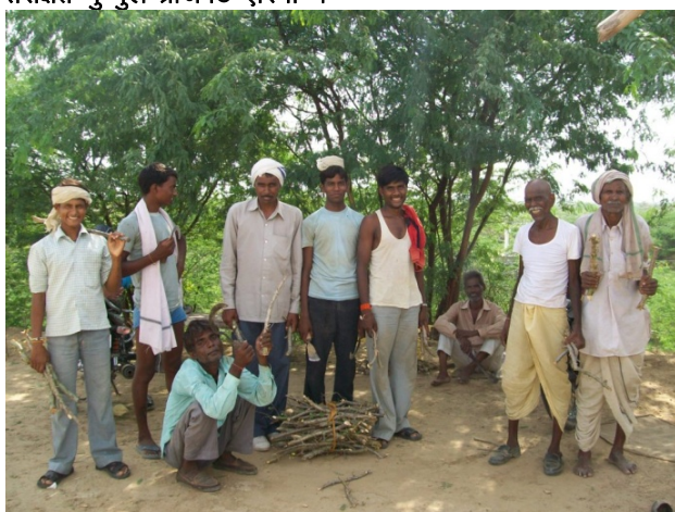
कटिंग विक्रय से आय वृद्धि।