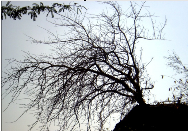
संरक्षित गुग्गुल से गोंद निकालकर समूहों की व लोगों की आय वृद्धि। (संरक्षित गुग्गुल प्रोजेक्ट एरिया में)