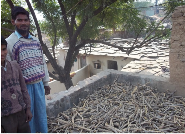
अग्निमंथ (चवनप्रास निर्माण हेतु) डाबर कम्पनी के द्वारा कय से आय वृद्धि। डौरबन्दी से बची खेती में लहलाहती फसल से आय वृद्धि।