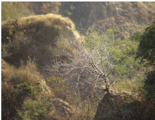
संरक्षित गुग्गुल प्रोजेक्ट एरिया में