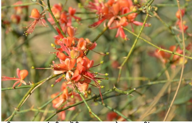
करील का फूल (करील टैटी का अचार से आय वृद्धि)