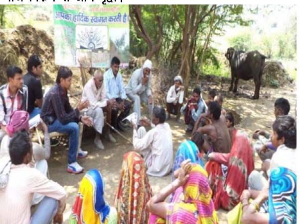
आय वृद्धि व क्षमता वृद्धि की गई।